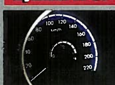
Hyundai iX 35

Přístroje v Hyundai se nám líbily jednoduchostí, motor ale překvapil velkým apetitem